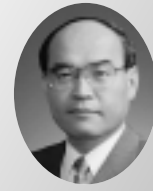
石川県知事 谷 本 正 憲