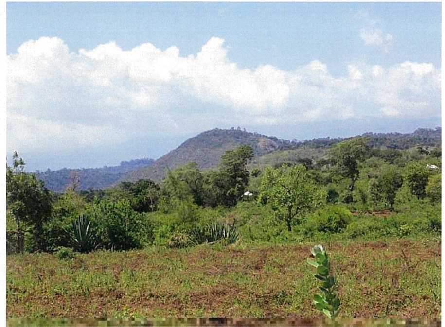
火災で燃えた植林地のある尾根（写真中央の丘）