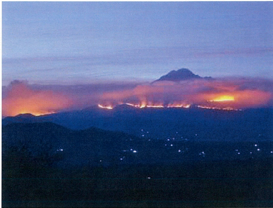
昨年 10 月に起きたキリマンジャロ山の大規模森林火災