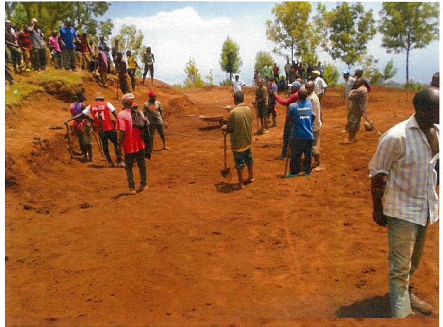
防火帯を設置する村人たち