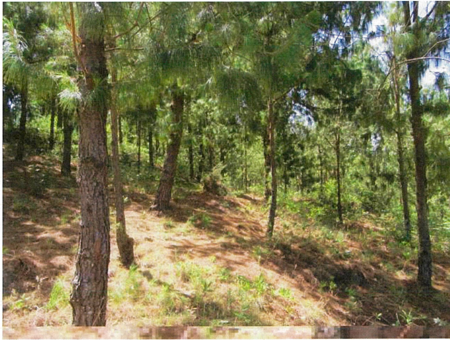
火災を免れた植林地の木々