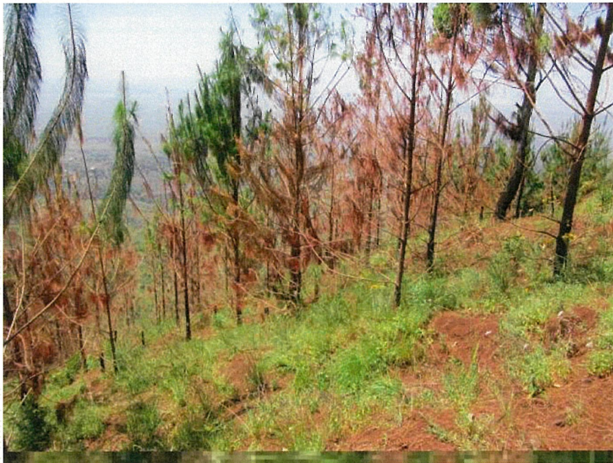
火災で燃えた植林地の木々