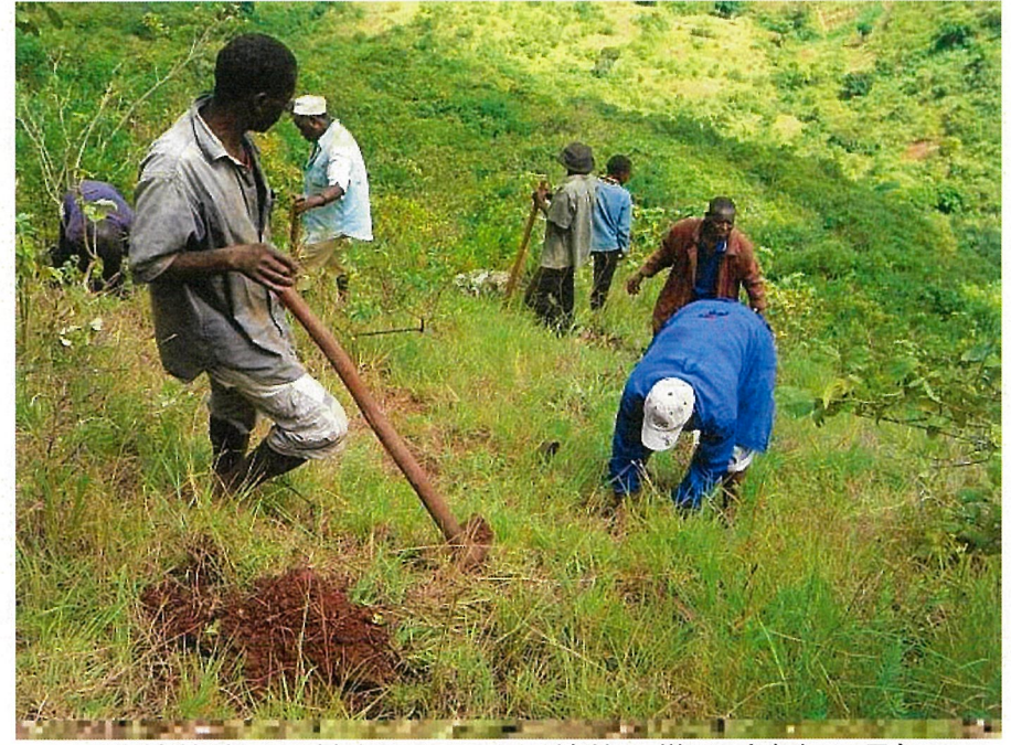
同じ植林地での村人たちによる植林の様子（昨年6月）