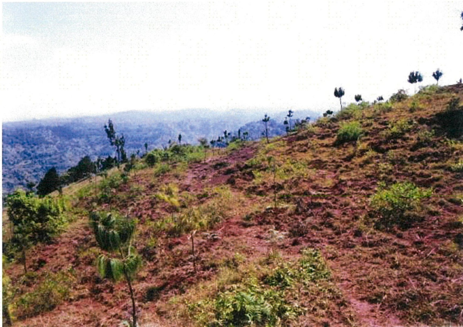
植林される前の状況